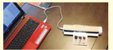
▲画像の取り込みだけでなく、文字認識もできるスグレモノ。

最近ハマっている「ScanSnap(スキャンナップ)」というスキャナー。コンパクトで取り込みも早く、パソコン・スマホ・デジタルフォトフレームでも写真が見られます。書類やレシピもこれでデータ化します(文字検索ができ、整理も簡単)。データ化すれば、物自体を減らせてすっきりと暮らすことができますよ。